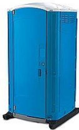
Foto 4.1 Baño portátil estándar

Para el mantenimiento se utilizarán camiones livianos con equipos de succión (Foto 4.2), que cuentan generalmente con tanques de almacenamiento de 4,0 m 3 , en aquellos sitios específicos de torre en donde el acceso lo permita; en donde la accesibilidad sea difícil para este tipo de vehículos, se utilizarán bombas de succión manual en donde los desechos se almacenarán en canecas de 50 lts para posteriormente retirarlas en vehículos livianos y entregarlas al gestor de este tipo de residuos.