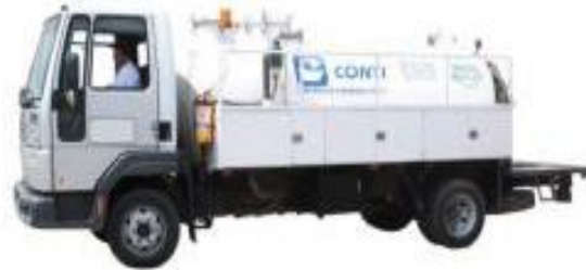
Foto 4.2 Equipo de succión tipo vector

De acuerdo con lo expuesto, el proyecto no generará aguas residuales domésticas ni industriales en ninguna de sus fases (construcción y operación). Igualmente, en la fase de mantenimiento operacional no se generan aguas residuales domésticas.