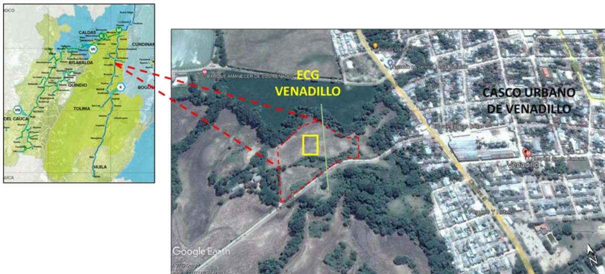
Figura 1. Localización general - Estación de compresión de gas Venadillo

La Estación de Compresión de Gas Venadillo estará ubicada en la vereda La Cubana, cerca al occidente del casco urbano del municipio de Venadillo en el departamento del Tolima ( Figura 1), a 60 kilómetros al Nororiente de la ciudad de Ibagué y en el PK 354+670 del gasoducto Centro-Oriente.