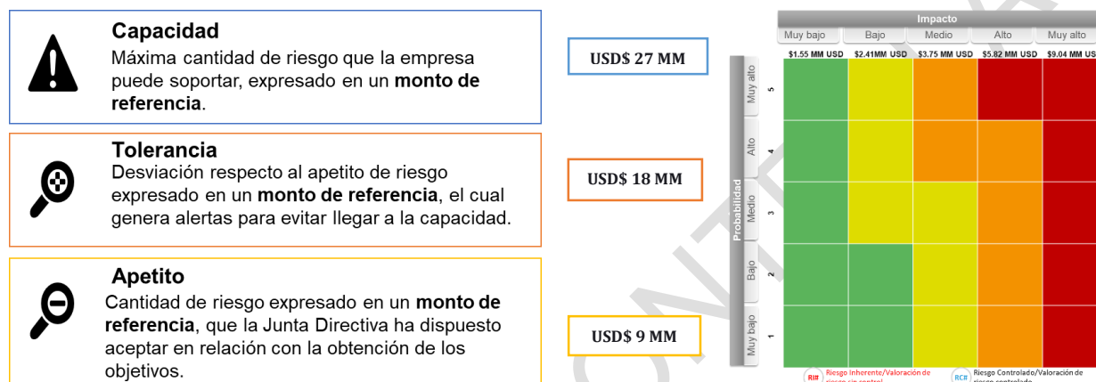
Figura 2. Definición de apetito, tolerancia y capacidad para riesgos de la contratación

A continuación, se exponen la capacidad, tolerancia y apetito de riesgos definidos a nivel contractual, estas variables están alineadas con lo definido a nivel estratégico por la organización, y orienta la toma de decisiones y las pautas para el manejo, gestión y tratamiento del riesgo.