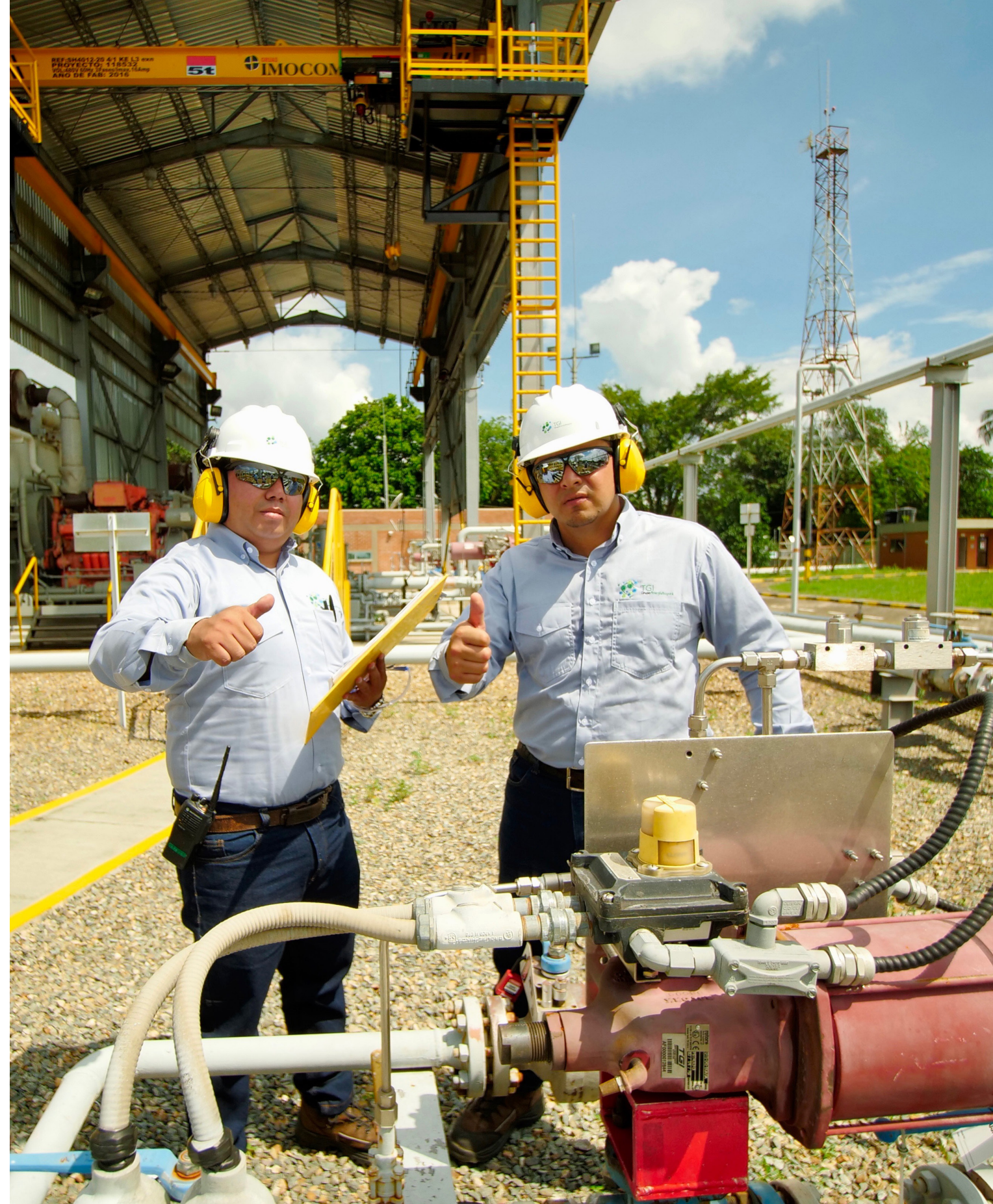
Colaboradores de TGI en la estación de compresión de Mariquita (Tolima)

Seguiremos fortaleciendo el Modelo de Gobierno Corporativo, alineado con el del Grupo Energía Bogotá.