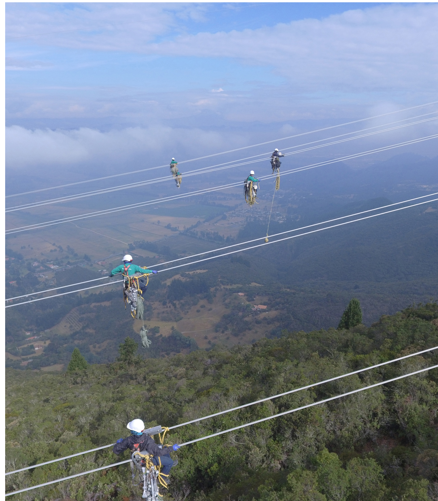
Mantenimiento de líneas de transmisión en Guavio-Circo en Guasca, Cundinamarca

Incluiremos innovación y nuevas tecnologías en el marco de la Transformación Energética.