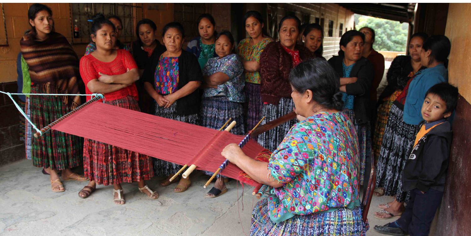
Mujeres tejedoras de Guatemala

(102-47) Este proceso nos permitió identificar diez temas prioritarios para nuestra gestión como Grupo Empresarial; los presentamos a continuación en su orden de prioridad: