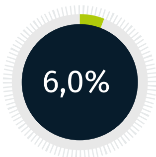
Crecimiento en INGRESOS del GEB.