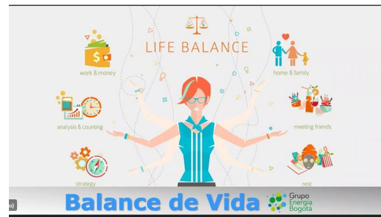
Charlas de balance