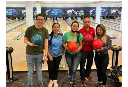
Torneo de bolos