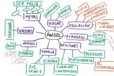
Importancia del reconocimiento