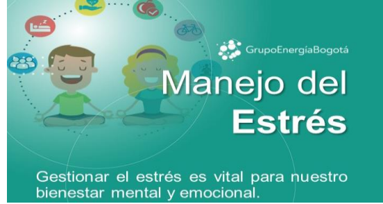
Taller Bienestar físico, social y emocional Gestión y manejo del estrés (2022)