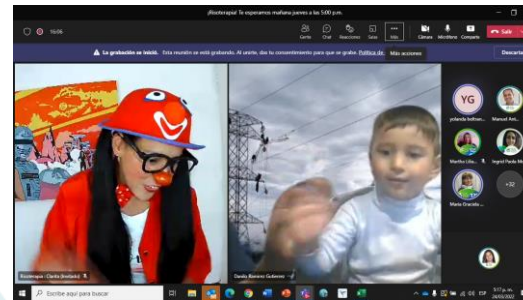
Taller Risoterapia (2022)