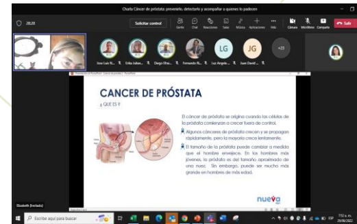
Charlas de prevención