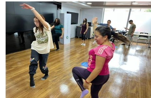
Taller de danza