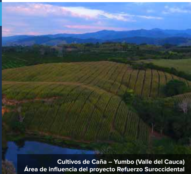
Cultivos de Caña – Yumbo (Valle del Cauca) Área de influencia del proyecto Refuerzo Suroccidental

El proyecto de transmisión de energía eléctrica Refuerzo Suroccidental es de gran importancia para la región y el país, pues fortalecerá el sistema nacional energético y mejorará la calidad y confiabilidad del servicio en Antioquia, Caldas, Risaralda y Valle del Cauca . El Ministerio de Minas y Energía fue el que estableció la obligatoriedad de su desarrollo, debido al crecimiento de la demanda energética de Colombia.