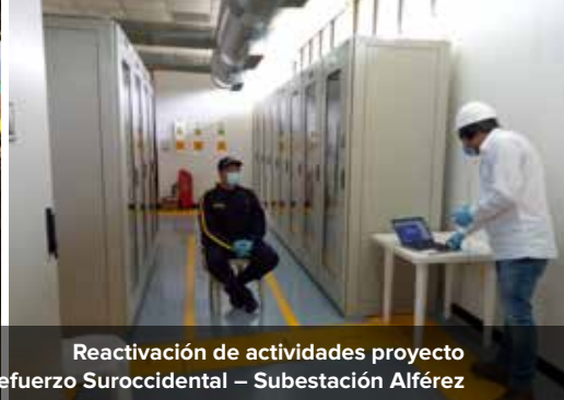
Reactivación de actividades proyecto Refuerzo Suroccidental – Subestación Alférez