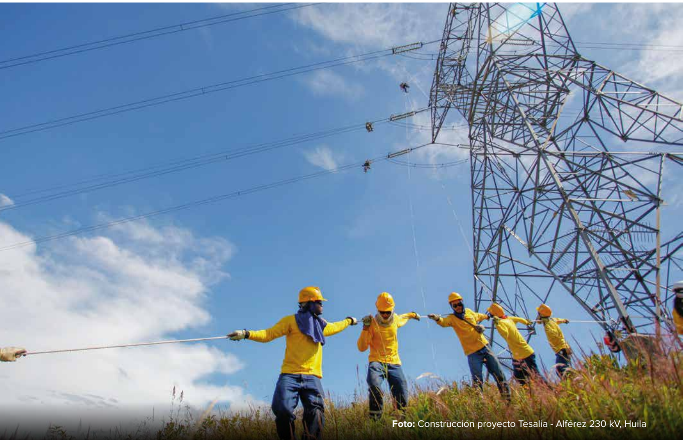
Foto: Construcción proyecto Tesalia - Alférez 230 kV, Huila

En el proyecto Refuerzo Suroccidental estamos próximos a iniciar la etapa constructiva del primer tramo, el cual va desde la Subestación Medellín , ubicada en el municipio de Heliconia (Antioquia), hasta la Subestación La Virginia , ubicada en Pereira (Risaralda). Trabajaremos en la construcción de 338 torres y 179,78 kilómetros de líneas , que permitirán contribuir al desarrollo de la región mediante una mejor calidad del servicio de energía, y dirás cada vez menos ¡se fue la luz!