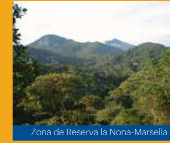
Zona de Reserva la Nona-Marsella

Ven a conocer Marsella, la comunidad recomienda: