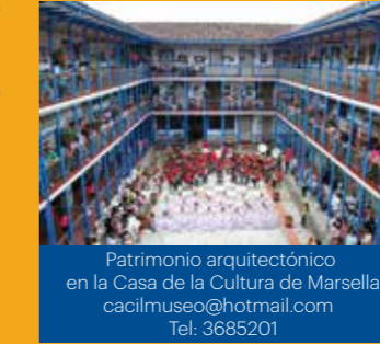
Patrimonio arquitectónico en la Casa de la Cultura de Marsella cacilmuseo@hotmail.com Tel: 3685201

Este municipio ofrece una arquitectura que nos transporta en el tiempo: sus angostas calles y sus casas de balcones florecidos, que se confunden con las pintorescas fachadas, hacen sentir que el tiempo se ha detenido; adornado tanto por la arquitectura como por la amabilidad de sus gentes, quienes comparten alegremente no sólo un café producido por las manos que labran la tierra, sino sus riquezas intelectuales, poéticas, culturales y sus historias de arrieros que llevaron a abrir los caminos que trajeron el desarrollo de sus municipios y que hoy con todo un tesoro cultural abren las puertas al mundo demostrando porqué Marsella hace parte del Paisaje Cultural Cafetero, patrimonio de la humanidad.