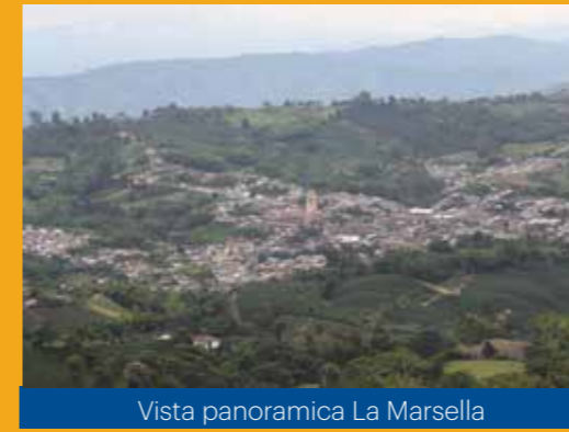
Vista panorámica La Marsella

Ven a conocer Marsella, la comunidad recomienda: