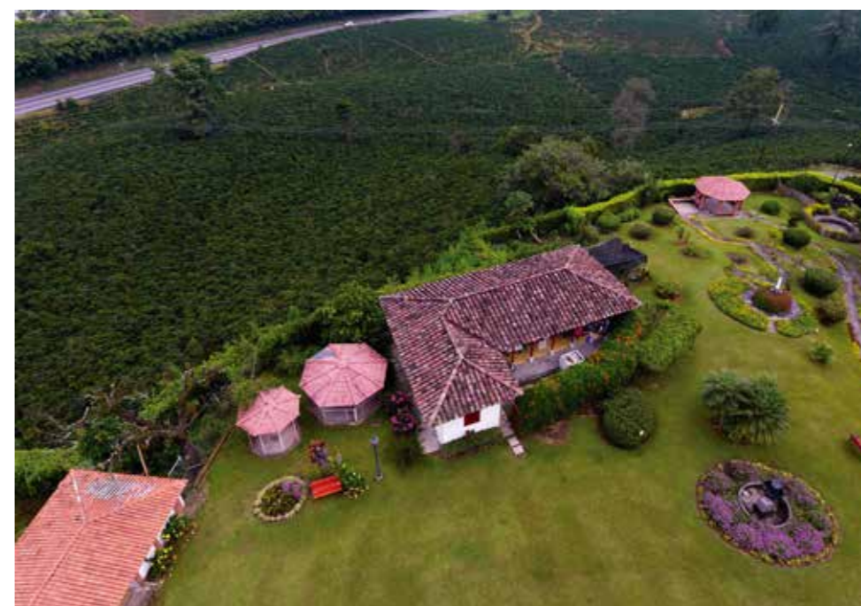
Finca Cafetera, vía Manizales-Pereira

El 25 de junio de 2011, el Comité de Patrimonio Mundial de la UNESCO, declaró Patrimonio Mundial el Paisaje Cultural Cafetero de Colombia debido a que en varios de los sistemas montañosos de Caldas, Quindío, Risaralda y Valle del Cauca se han desarrollado zonas representativas de producción de café que constituyen un conjunto por sus atributos, las relaciones entre los habitantes y la herencia cultural. Este paisaje vivo productivo está conformado por 51 municipios y 858 veredas.