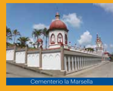
Cementerio la Marsella

Este municipio ofrece una arquitectura que nos transporta en el tiempo: sus angostas calles y sus casas de balcones florecidos, que se confunden con las pintorescas fachadas, hacen sentir que el tiempo se ha detenido; adornado tanto por la arquitectura como por la amabilidad de sus gentes, quienes comparten alegremente no sólo un café producido por las manos que labran la tierra, sino sus riquezas intelectuales, poéticas, culturales y sus historias de arrieros que llevaron a abrir los caminos que trajeron el desarrollo de sus municipios y que hoy con todo un tesoro cultural abren las puertas al mundo demostrando porqué Marsella hace parte del Paisaje Cultural Cafetero, patrimonio de la humanidad.